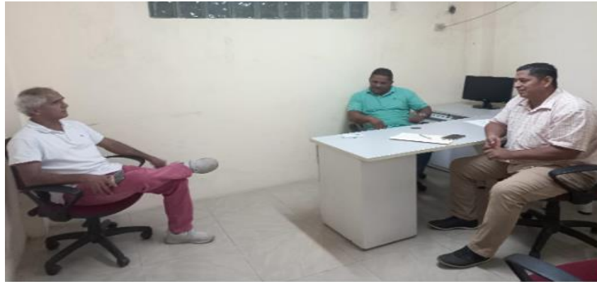
Reunión en la Comisaria Nacional, tratando temas de índole Parroquial